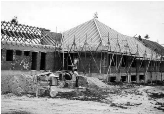
Richtfest vom neuen Sportheim