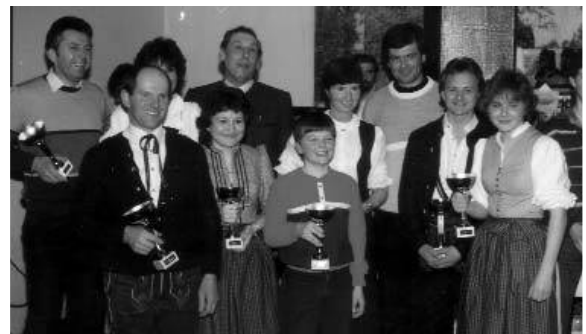
Skiclub Siegerehrung 1982