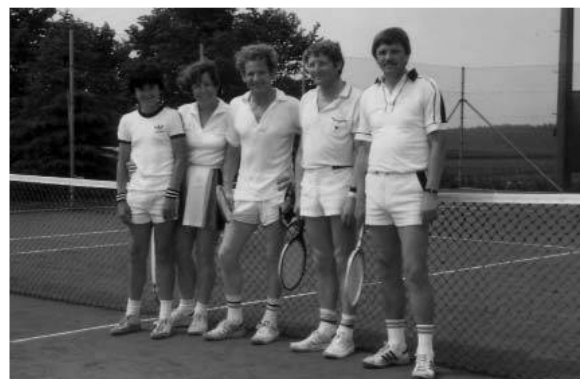
Tennis Siegerehrung 1980

1979 Anlässlich der 1200-Jahrfeier der Pfarrgemeinde Vierkirchen wurden die 4 Tennisplätze eingeweiht und ihrer Bestimmung übergeben.