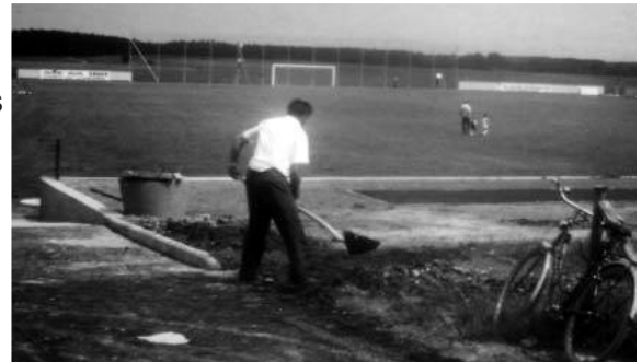
Arbeiten am Hartspielplatz

1971 Der Hartspielplatz wurde erstellt und in den Sommermonaten von der Damen-Gymnastikabteilung als Übungsplatz genutzt. Kurz vor Vollendung dieses Hartspielplatzes ist der Gedanke aufgekommen, dass man hier auch Tennis spielen könnte. Eine interessierte Gruppe von ca. 40 Personen hat sich dann auch mit Tennis auf dem Hartspielplatz beschäftigt. Damit war der Sport-Club Vierkirchen der erste Verein auf dem Land, bei dem das Racket Einzug gehalten hat.