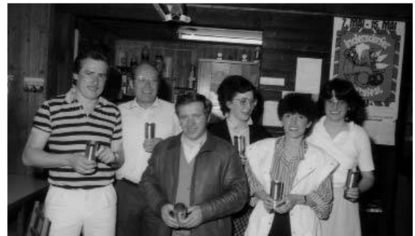
Tischtennis Siegerehrung 1983