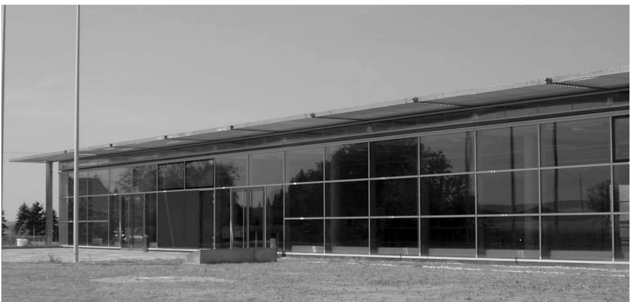
Unsere neue Dreifach-Sporthalle in voller Pracht

2004 Der Spielbetrieb in der noch nicht ganz fertiggestellten Dreifach-Sporthalle wurde Ende des Jahres aufgenommen.