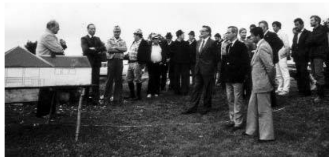
Das Modell des neuen Sportheims wird vorgestellt