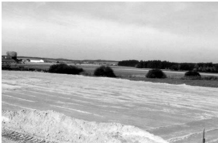
Das neue Spielfeld in der Bauphase