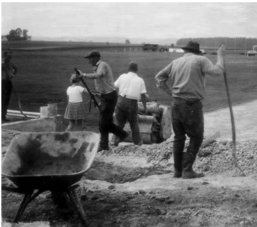
Letzte Arbeiten am neuen Sportplatz