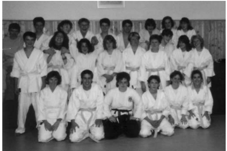
Jiu-Jitsu Abendgruppe 1989